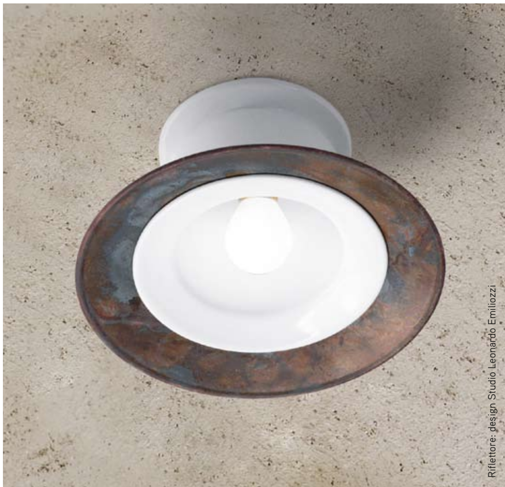
Riflettore: design Studio Leonardo Emiliozzi